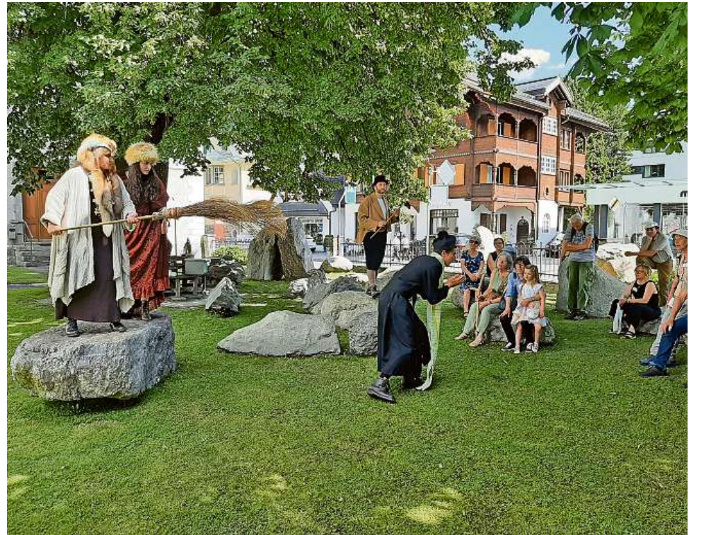
Las stris dil Crap Grisch han spitgau la caschun ch'il prer ha emblidau sia stola.

Il raquintader e guid discuora tudestg e romontsch, adina puspei vegnan plaids originals, nams e discurs el lungatg dalla regiun. Avon la casa cumin lai el prender part dalla detga dil crap dil giavel da Surcasti. Il giavel fa impres-