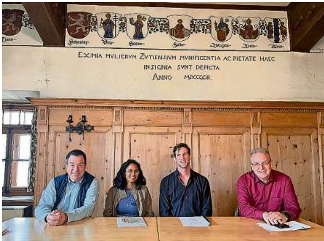
Ils chos davous il proget haun infurmo davart il festival.