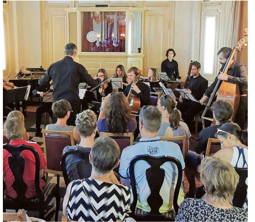
Ùn evenimaint gratià es stat l'Ensemble Filarmonic Engiadina cun «La flauta magica».