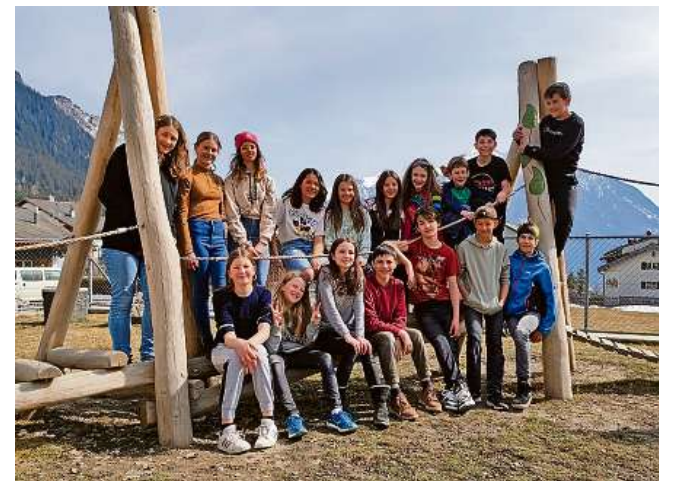
Iglis unfants dalla 5avla e 6avla classa digl consorzi da scola Val Alvra Dafora a Lantsch sa participeschan alla concorrenza #klappeauf.