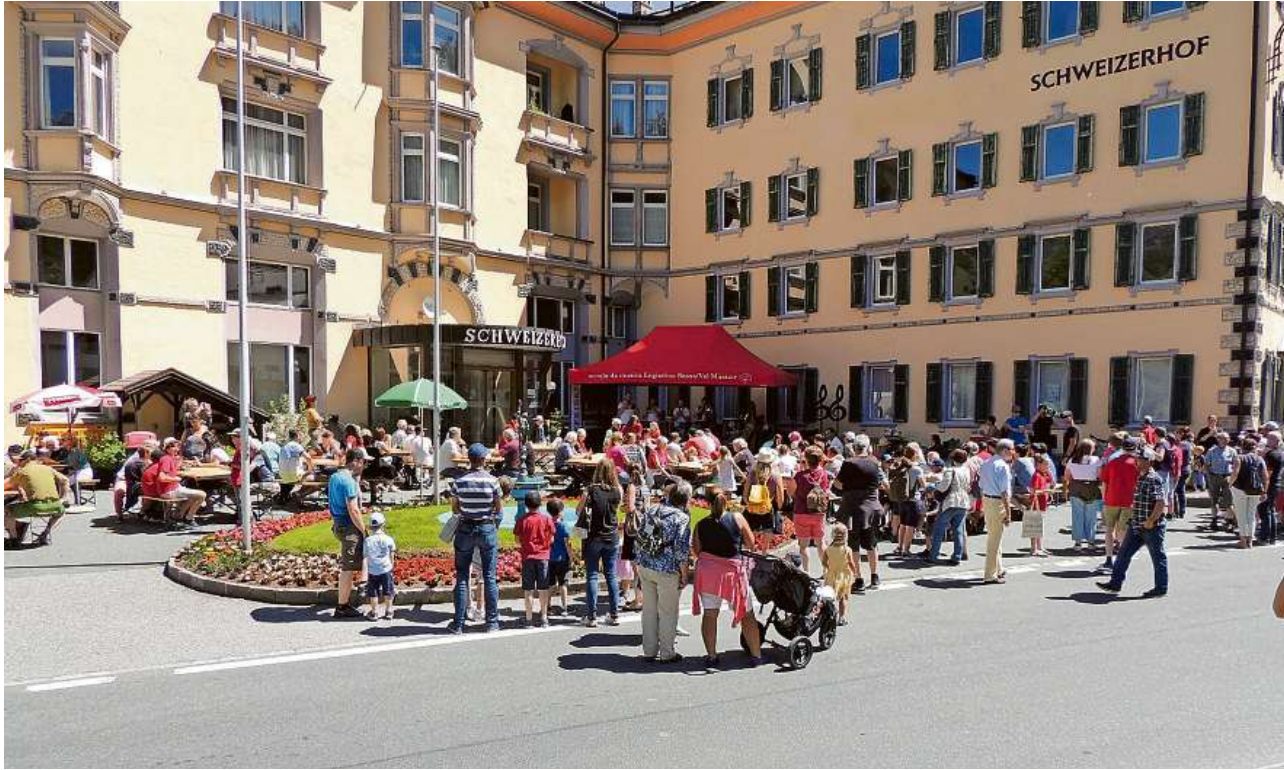
L'evenimaint a Vulpera es stat fich bain visità.