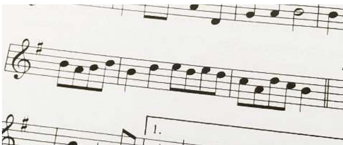
Sper far part digl program digls «Gis digl tgant da Schons 2022» pon ign ear sapatizipar digls curs da la sera cun canzuns rumantschas.

Igls «Gis digl tgant 2022» sadrezan a cantaduras a cantadurs cun experientzgas da cantar an chors. Las notas a las audiotecas da las canzuns rumantschas vignan messas a disposiziùn oravànt. Igl program da lez'eanda preveza provas durànt sis uras (9.00-11.45; 16.15-17.45, 19.30-21.20). Ear uon e'gl pussevel da frequentar me igls curs