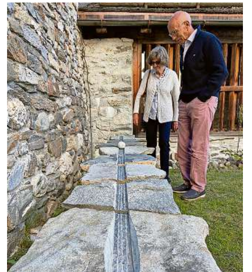
In vial da ruclas fascinescha pigns e gronds cun ses tuns carpus.