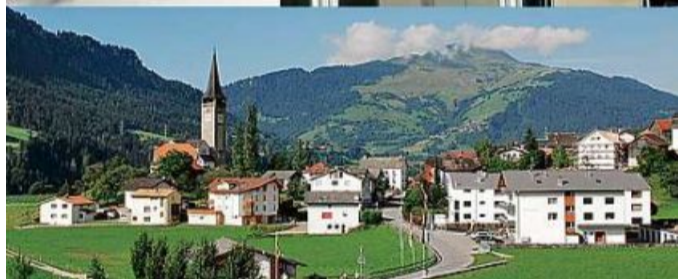
Laax e Sagogn – gleiti ina vischnaunca?