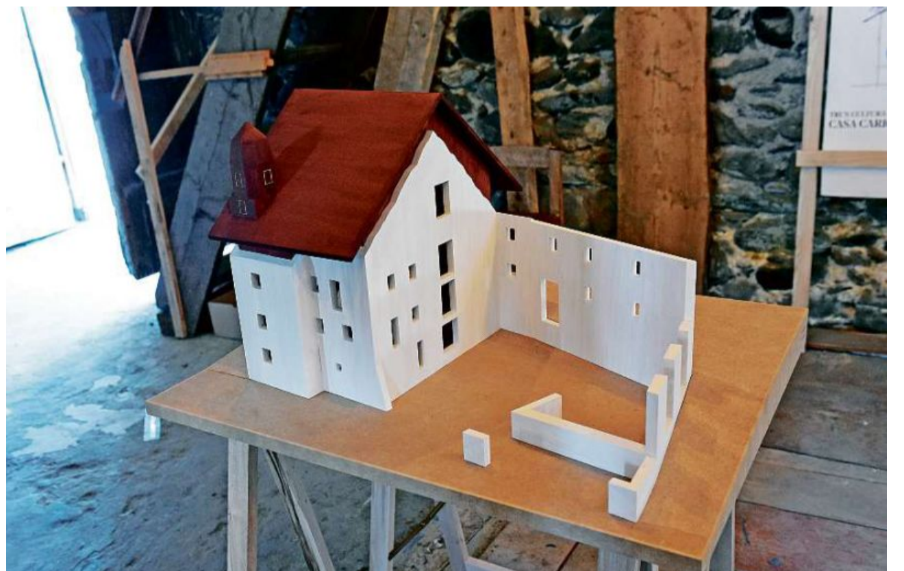
L'uniun Trun Cultura s'engascha per mantener las valurs culturalas da Trun – sco il center cultural.