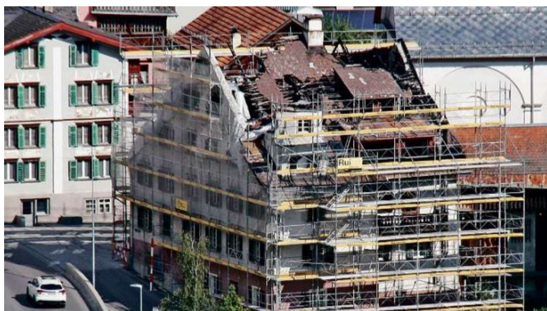
Il baghetg all'entrada da Trun grevamein donnegiaus dad in incendi retscheiva en cuort in tetg provisoric.