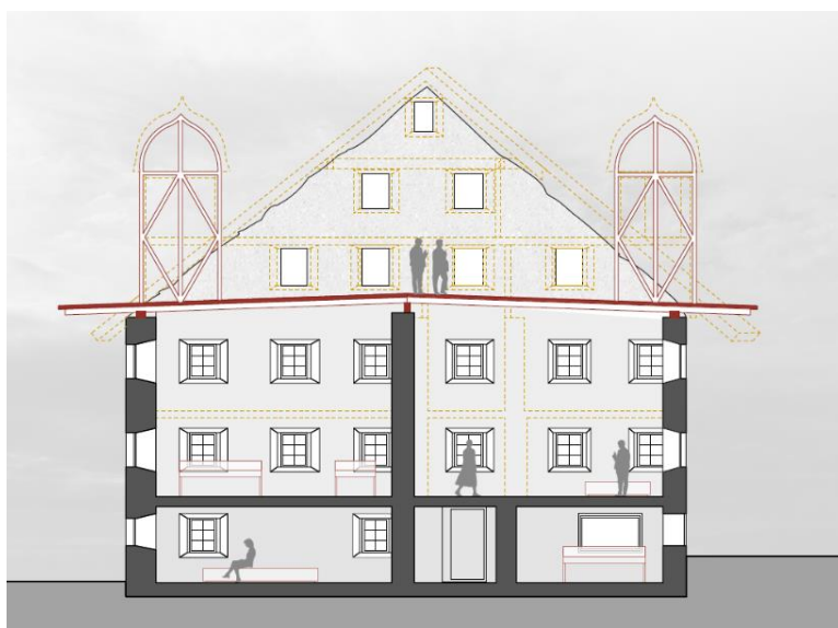
Entwurf Casa Carigiet, Schnitt und Ansicht Nordfassade (gasser, derungs, Sept. 2022)

Unser überarbeitetes Konzept wurde sowohl vom Gemeindevorstand wie auch von der kantonalen Denkmalpflege wohlwollend zur Kenntnis genommen. Bald erfahren Sie mehr.