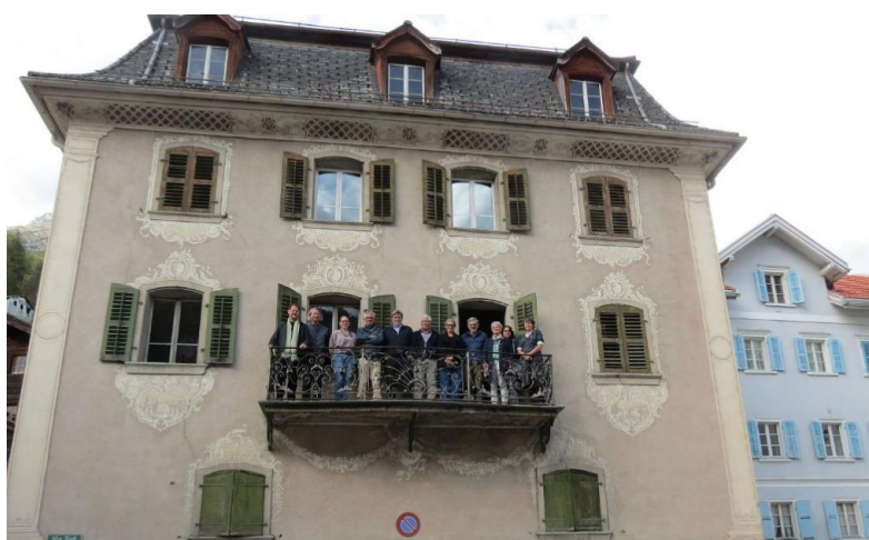
Vertreterinnen und Vertreter von Trun Cultura und des Museum Sursilvan Cuort Ligia Grischa auf dem Balkon der Casa Desax in Trun.

Die CASA DESAX befindet sich bekanntlich bereits seit dem Sommer 2021 im Besitz von Trun Cultura (im Baurecht für 99 Jahre). Wir nehmen den prächtigen Rokokobau per sofort in Beschlag, und zwar als temporäres Office von Trun Cultura. So fanden hier – sozusagen am Ort des künftigen Geschehens – bereits am 11. Oktober eine erste Sitzung des Fachausschusses und ein Treffen mit Vertreterinnen und Vertretern des Museums Sursilvan Cuort Ligia Grischa statt. Baubüro und Geschäftsstelle werden ab Frühjahr 2023 hier einziehen.