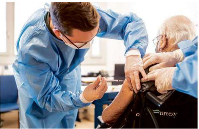
Ei vegn vaccinau mordio il mument.