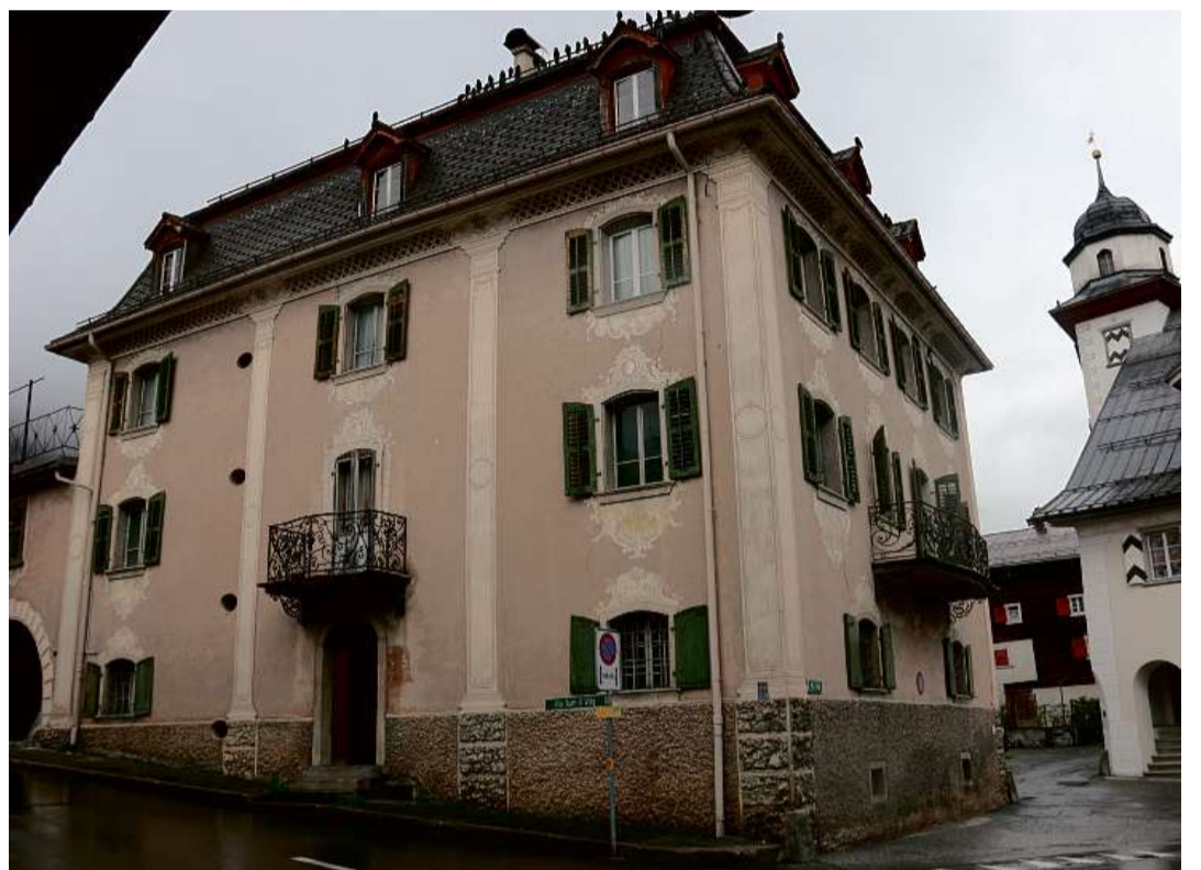
La Casa Desax a Trun ei vegnida baghegiada 1782.